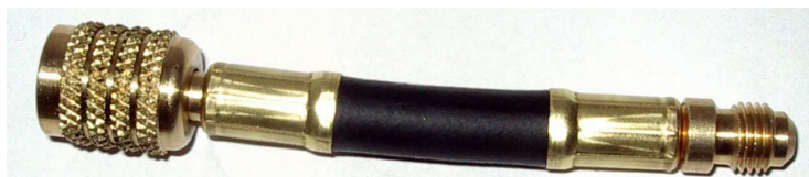
Adapter Flex pro R410A. Vnější závit 7/16UNF, vnitřní závit 1/2"